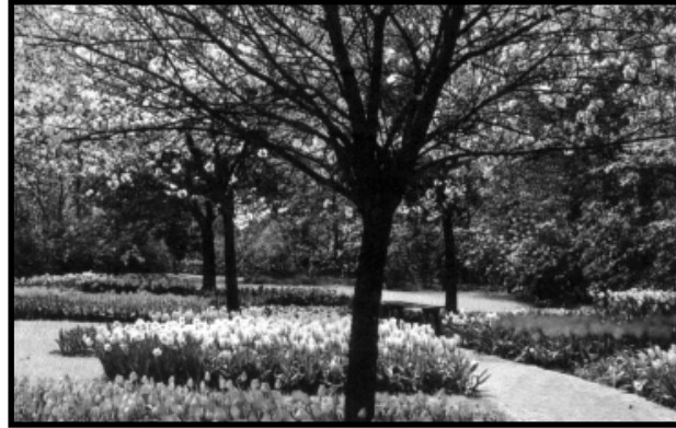
આવો કરીએ વસંતના વધામણા! જીવનને રંગોથી ભરીને પ્રકૃતિને મન ભરીને માણીએ.

આપણને ફેંકી દેશે. પ્રકૃતિની સાથે રહીશું તો તે આપણને સ્વીકારશે. તો નૂતન વર્ષે આપણે સૌ એક બાબત જરૂર સમજી લેશું.