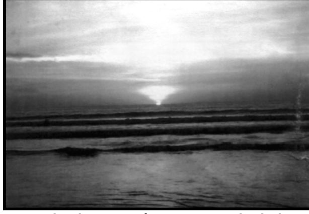
કુદરત પોતાનો પ્રકાશ સૂર્ય દ્વારા પૃથ્વી પર રેલાવે છે ત્યારે સોનેરી સવાર થાય છે.

પરોઢિયે મંદિરની ઝાલર વાગતી હોય, મસ્જિદે બાંગ પોકારાતી હોય, સ્તુતિ, આરતી અને બંદગી જગદીશ્વરને ધરતી પર આવવા-પધારવા સૌને આશીર્વાદ આપવા રીઝવતા હોય, મંદ પવન લહેરાતો હોય, લોકો નાહી-ધોઈ તૈયાર થઈને દર્શને જતાં હોય અને તે પછી જ પોતાને કામધંધે ચડતા