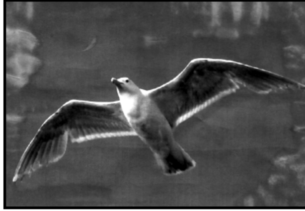
ચાલો, સવાર પડી. આકાશી ઉડાન ભરીને સવારની તાજી હવાની મજા માણી લઈએ.