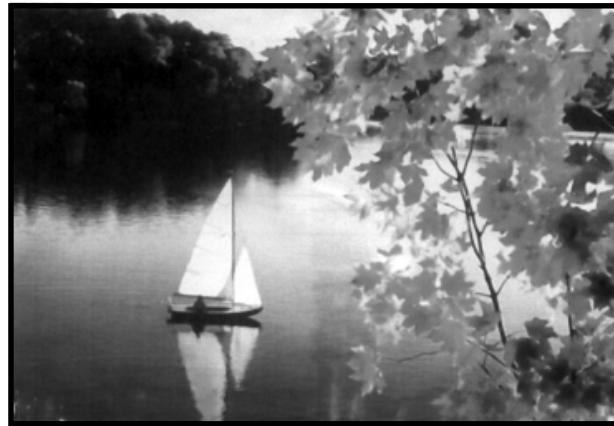
જળ પર સંતુલન જાળવીને હોડી કિનારે પહોંચે છે. માનવી પણ સંસારમાં જલકમલવત્ રહીને સંસારરૂપી સાગર પાર કરવા સંતુલન જાળવે તે જરૂરી છે.

હોય તેમાં અનેરો આનંદ ઉત્સાહ જોવા મળતો હોય છે.