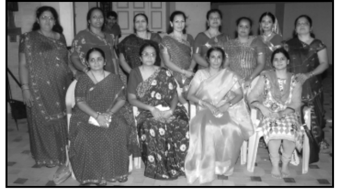
નવરાત્રી મહોત્સવ-૨૦૧૧ દાતા પરિવાર સાથે મહિલા મંડળના સભ્યો