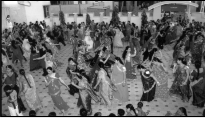
નવરાત્રી મહોત્સવ-૨૦૧૧. રાસ રમતી બહેનો.