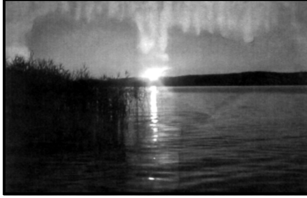
મનમોહક સંધ્યા રંગોથી વધુ સુંદર લાગે છે. પરંતુ હવે તુરતમાં જ રાત્રિનો અંધકાર છવાઈ જશે તેવો સંકેત પણ તે ચારે તરફ ફેલાવવા લાગે છે.

કાયમ યાદ રાખીએ : પ્રકૃતિથી અળગા થઈશું તો તે