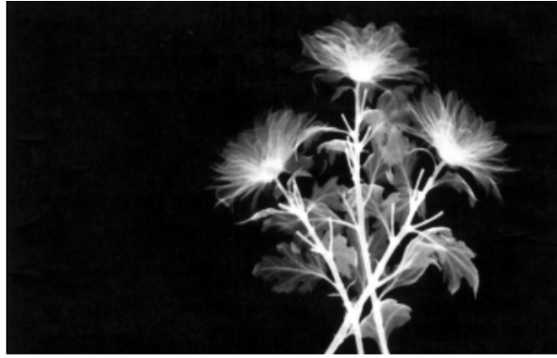
પુષ્પો સુંદરતાની સાથે સુગંધ પ્રસરાવે છે. હળીમળીને રહેતા પુષ્પો એકતાનો સંદેશ અને સુવાસ ફેલાવે છે.