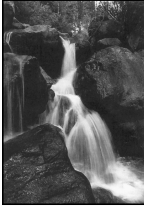
કલકલ સુમધુર ધ્વનિ સાથે ખડકો પરથી વહેતું પાણી સુંદર ઝરણાનું સર્જન કરે છે.

આપત્તિ વખતે ઉદ્યમ જ એકમાત્ર સહારો બની રહે છે. તેની સાથે-સાથે પણ આનંદને જાળવી રાખવાનું હોય છે. આનંદી સ્વભાવ દરેક સ્થિતિને સમભાવથી જ નિહાળે છે. જીવનના આનંદને કદી