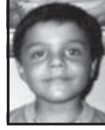
યશ શરદ ભારમેડા ભુજ ધોરણ-૪ : ૮૭.૩૩%