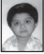
યશ્વી કમલેશ પોમલ ભુજ જુનીયર કે.જી. : ૮૬.૫%