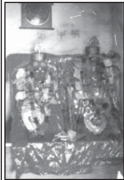
શ્રી વેરાઈ માતાજી અને શ્રી ચામુંડા માતાજી શ્રી વેરાઈ માતાજી મંદિર, કુલપુર, તા. સાંતલપુર