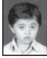
વિશ્વ હીરેન બુધ્ધભટ્ટી ધોરણ-૨ : ૯૫.૩૩%