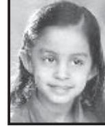
કિષ્ના જયેશભાઈ છગાળા ધોરણ-૩ : ૯૫%