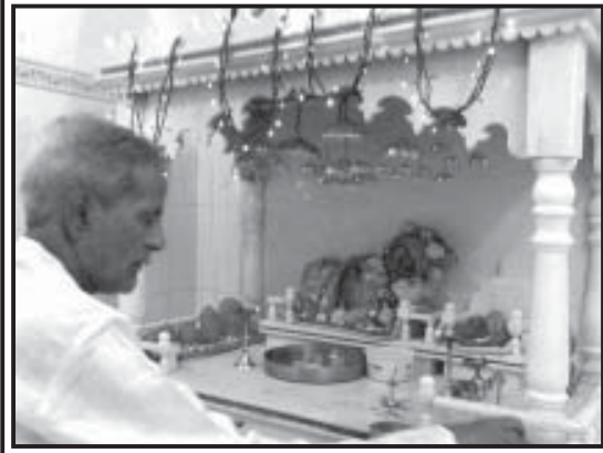
હેડાઉ કુટુંબના કુળદેવી માતાજીની પૂજા. કંસારાબજાર, નાના ફળીયા, ભુજ.

સમગ્ર ગુજરાત રાજ્યની આપણી જ્ઞાતિમાં ‘હેડાઉ’ પરિવારોની સંખ્યા પ્રમાણમાં ઓછી છે અને કૌટુંબિક સંબંધો પણ પેઢીઓ દૂરનાં હોય છે, છતાં નિયમિત રીતે એકત્રિત થવું, જુદા જુદા પ્રસંગો - ઉત્સવોની સાથે ઉજવણી કરવી અને પ્રેમપૂર્વક સક્રિય સંપર્કમાં રહેવાનાં તેઓનાં પ્રયત્નો નોંધપાત્ર અને ઉદાહરણીય છે.