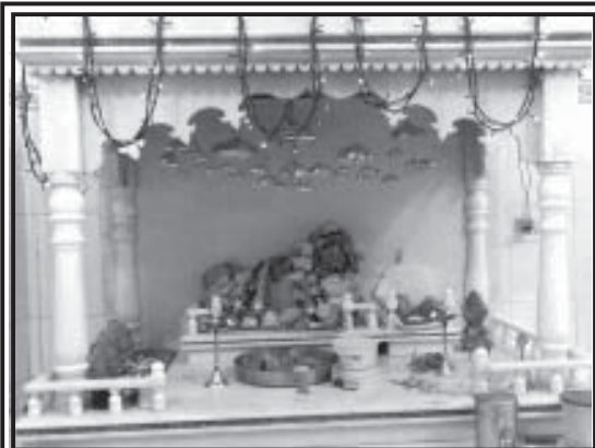
હેડાઉ કુટુંબના કુળદેવી શ્રી વેરાઈ માતાજી અને શ્રી ચામુંડા માતાજીનું દેવસ્થાન. વારાહી, ભુજ.